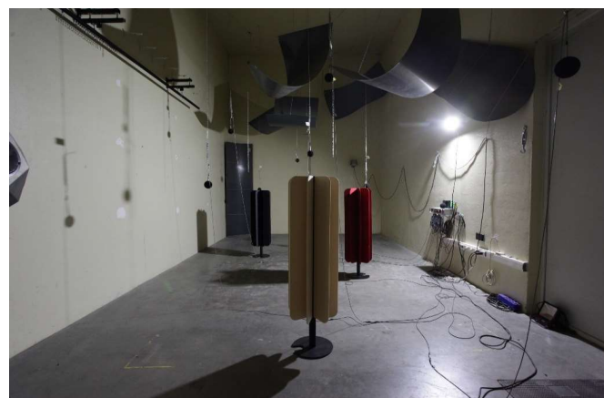
photo : arrangement d'essai avec 3 objets sur configuration 1