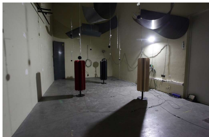
photo : arrangement d'essai avec 3 objets sur configuration 1