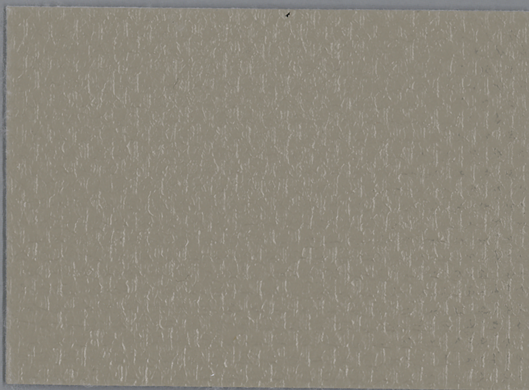
Échantillon peint - Painted sample